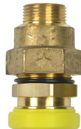
CALIBRE ÉQUIPÉ DU SYSTÈME CLAP